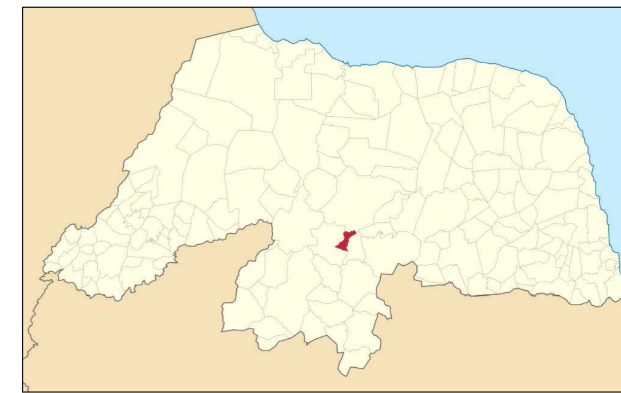
LOCALIZAÇÃO DO MUNICÍPIO NO MAPA ESTADUAL Escala 1/100